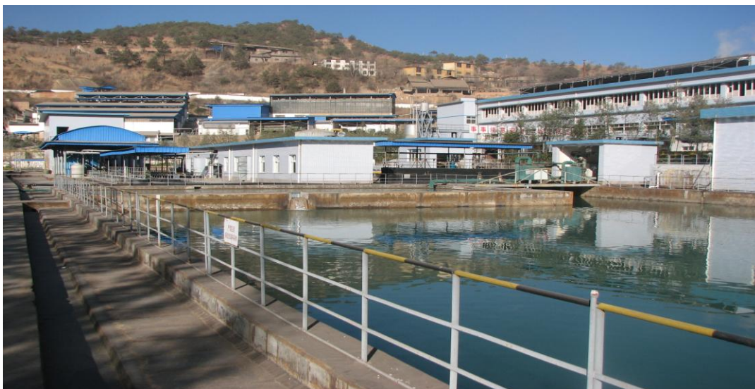
云南金鼎锌业有限公司污水处理总站图

公司建有与生产能力相匹配的污染处理设施，报告期内公司各项环保设施运行稳定，公司各成员企业按照相关法律法规对排污口进行了规范化建设，按要求安装了污染源在线监测系统。四川宏达股份有限公司、云南金鼎锌业有限公司、兰坪益云有色金属有限公司是国家重点监控的企业。各工业企业本年度监督性监测情况如下：