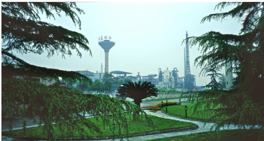
四川宏达股份有限公司有色生产基地厂区图