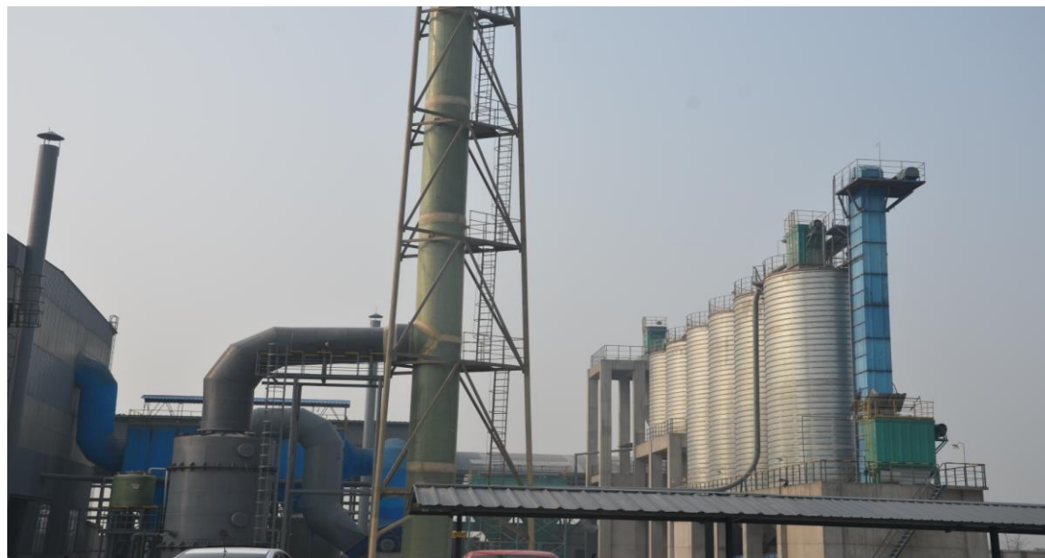
四川宏达股份有限公司磷石膏综合利用项目