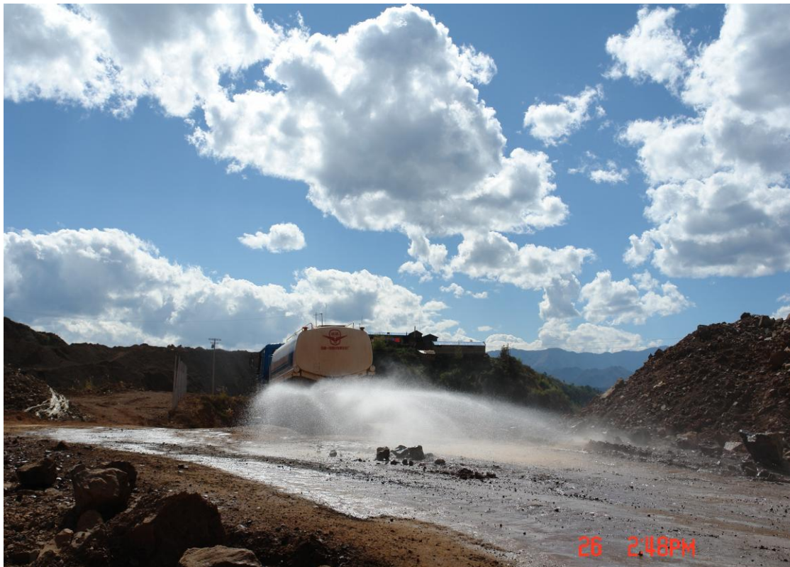
云南金鼎锌业有限公司矿区洒水降尘