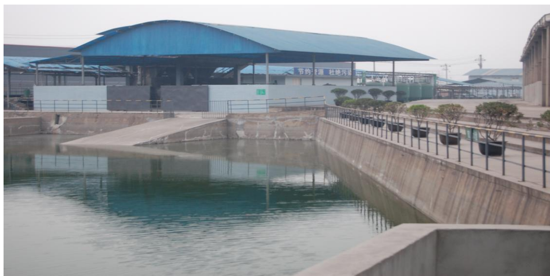
四川宏达股份有限公司有色生产基地污水处理总站图

公司各重点企业均开展日常环保监测，并与当地环境监测部门签订了委托监测协议，对企业排放的废气、废水和厂界噪声进行定期监测。监测报告结果显示，2012 年度，公司各成员企业污染物均实现达标排放。