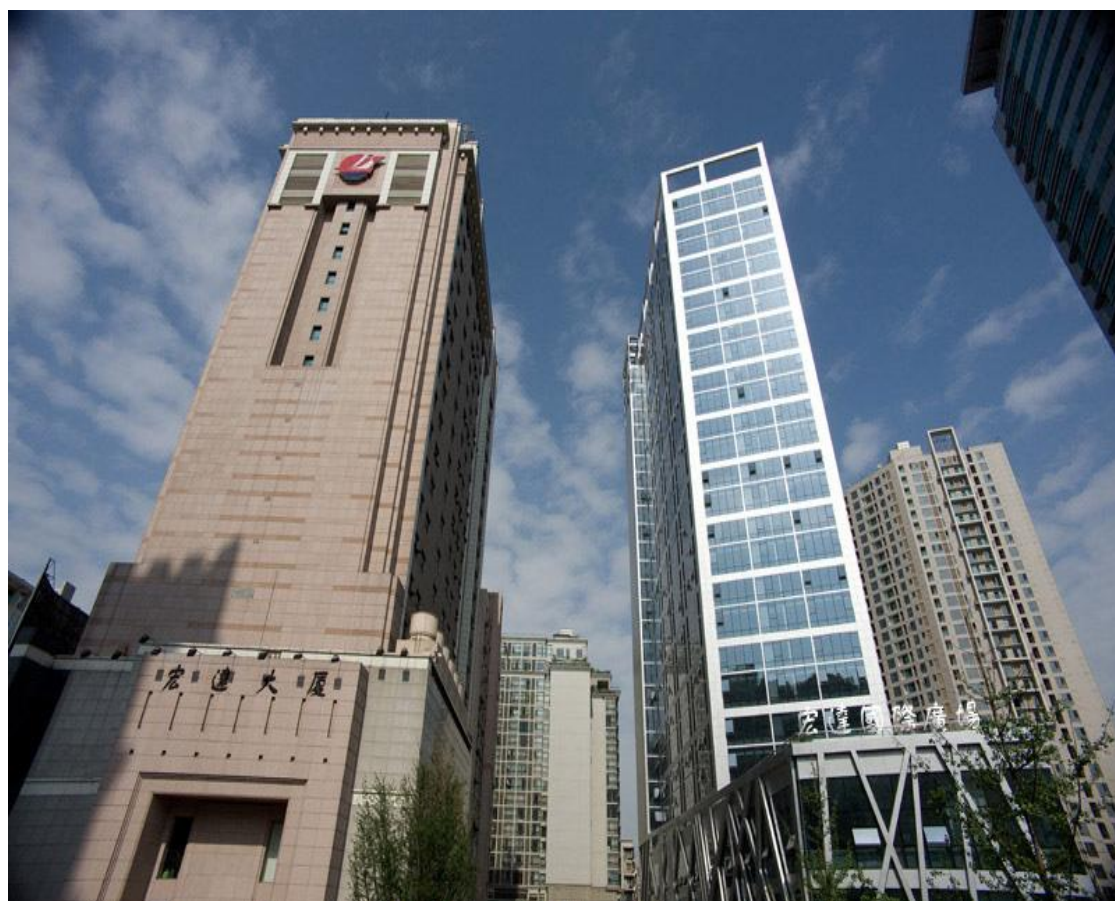
公司成都办公大楼图